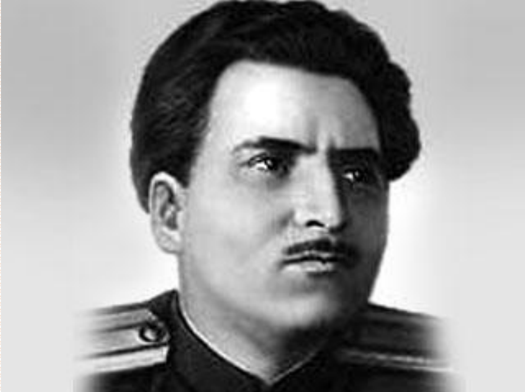
Константин Михайлович Симонов