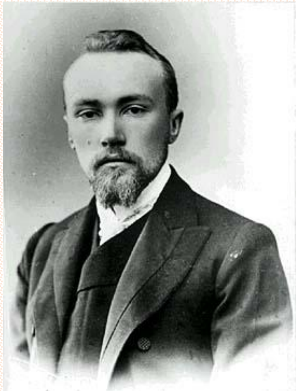
Николай Константинович Рерих